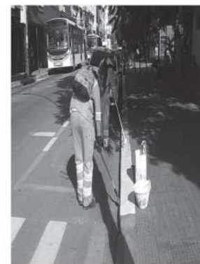
Pintura de meio-fio e postes de iluminação pública