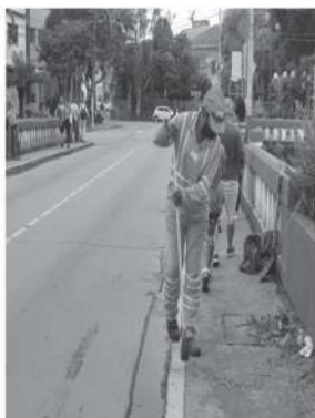
Varrição Manual de vias e logradouros públicos.

Os serviços de limpeza urbana em Barra do Piraí são de responsabilidade da Secretaria Municipal de Serviços Públicos e sua operação - varrição manual de vias e logradouros públicos; Roçada mecanizada; Capina; Limpeza manual de meio-fio e sarjetas; Pintura de meio-fio e postes de iluminação pública - é realizada por empresas da iniciativa privada e pela prefeitura.