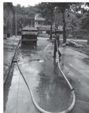
Limpeza manual de meio-fio e sarjetas.